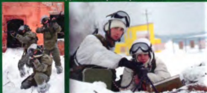
Водителем специальной техники

Специалистом подразделения немедленного реагирования