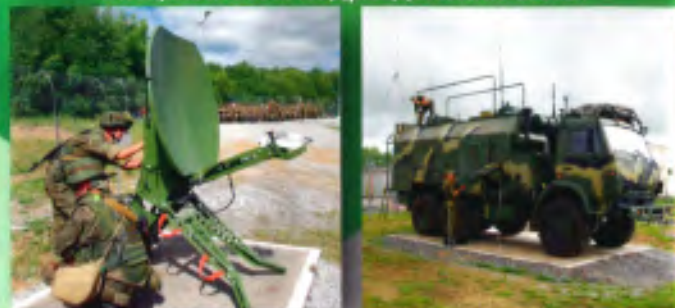
Специалистом по применению и эксплуатации средств охраны