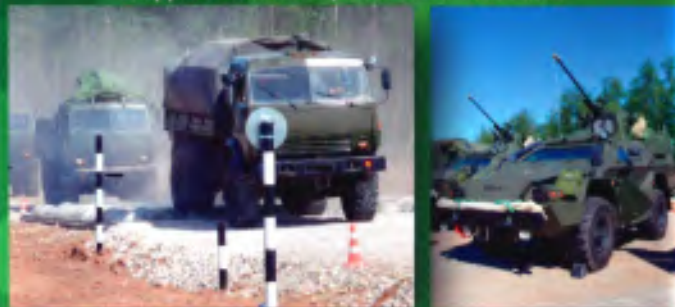
Специалистом подразделения связи